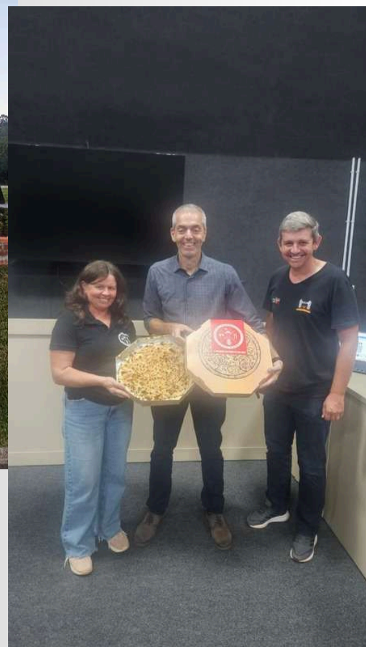
Integrantes colocando em prática os ensinamentos