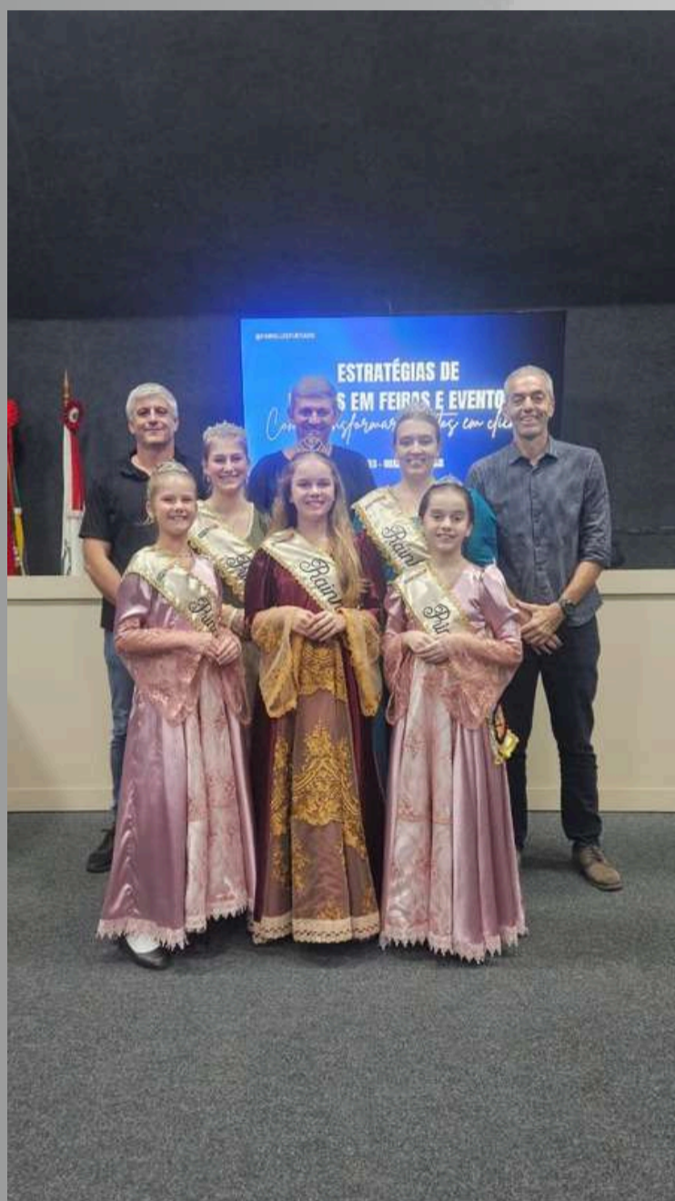
Com Prefeito e princesas da ExpoArabutã