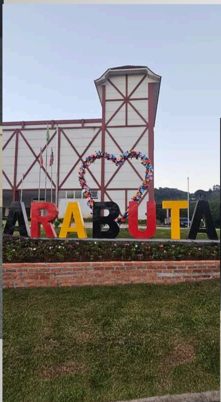
Centro de eventos de Arabutã